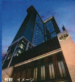
外観 / イメージ

・テレビ ・エアコン ・電話 ・インター ネット回線 ・セーフティボックス ・ミニ バー ・ボット ・シャワー ・ドライヤー