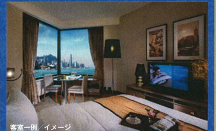
客室一例 / イメージ