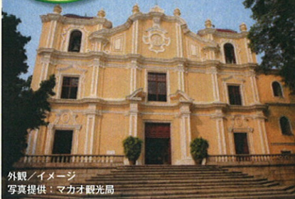
外観 / イメージ