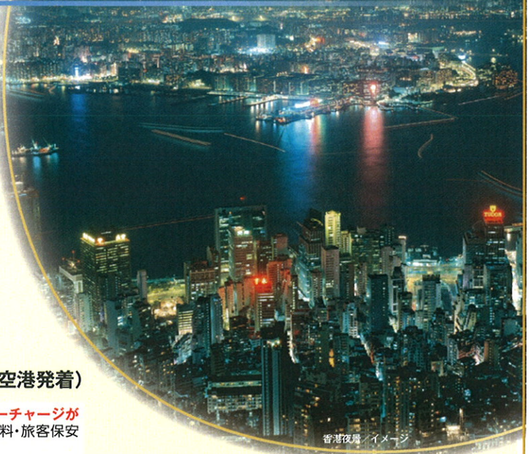
香港夜景 / イメージ

※当コースは燃油サーチャージが旅行代金に含まれています。今後、燃油サーチャージが増減した場合でも旅行代金に変更はございません。 ※国内空港施設使用料・旅客保安サービス料及び海外空港諸税は旅行代金に含まれています。