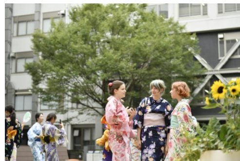
上智大学ホームページより

ぜひ引き続き留学生の支援もしていただきたいと思っています。特に大事なことは、留学生にとって今