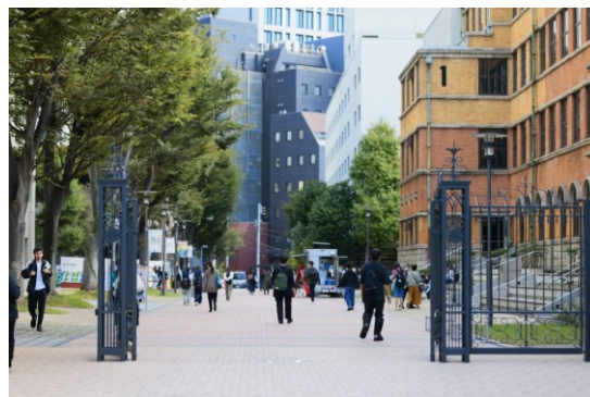
上智大学ホームページより

学校法人として、大学として、引き続き誇れるキャンパスを創り続け、何とか余力を生み出して新たな挑戦が行われる環境づくりに邁進していきたいと思っています。今後ともどうぞご指導、ご助言を賜りますよう、よろしく願いいたします。この機会を頂きましたすべての方々に心からの感謝を申し上げ、本稿を閉じさせて頂きます。誠に有難うございました。