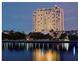
シェラトン ハノイ ホテル

ハノイの宿泊では、旧市街に近く朝夕の散策も気軽にお楽しみいただけるホテル「ホテル ジアン ハノイ」と、海外ソフィア会ハノイ大会の会場でもあるラグジュアリーホテル「シェラトン ハノイ ホテル」の2か所をご用意いたしました。滞在スタイルにあわせてお選びいただけます。(お申し込み時にご希望をお伺いいたします。)(ホテル ジアン ハノイから会場へはシャトルバスにてご案内します。)