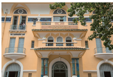
ベトナム美術博物館