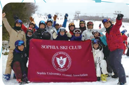
ソフィア会・スキークラブ