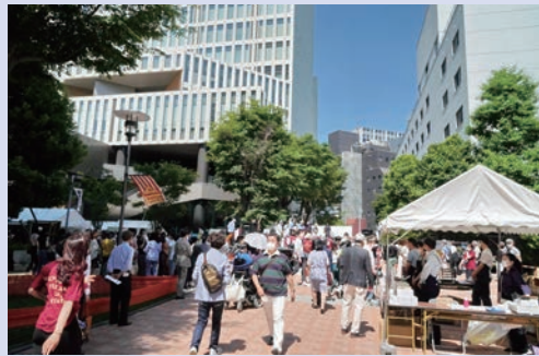
ASFの日はいつも快晴。昨年は、久々に四谷キャンパスに歓声がこだましました

毎年、5月の最終日曜日に行われ、1万人以上のソフィアンが参加するソフィア会最大のイベントが「オールソフィアンの集い（ASF）」。 2020年、2021年はオンライン開催となりましたが、2022年からはオンラインに加え、久々に四谷キャンパスにも大勢の卒業生が集まりました。リアルで顔をあわせ、海外など遠隔地の卒業生もオンラインでつながることができました。