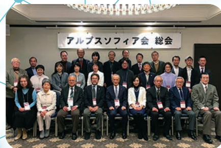
アルプス・ソフィア会