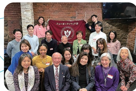
ニューヨーク・ソフィア会

ソフィア会には、大学時代とはまた違う、学部学科やクラブ、サークルを超えた出会いがあります。