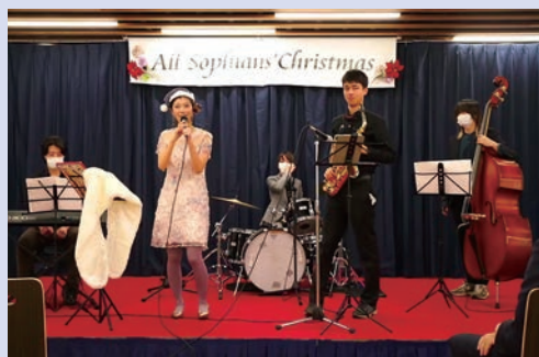
第二部の「つどい」では学生もパフォーマンスを

このASFに並ぶ年末のイベントが「オールソフィアンのクリスマス（ASC）」。 これも2022年はオンラインとリアルとのハイブリッドで開催。第一部の厳かなミサの後には、学生団体も含めたパーティで盛り上がります