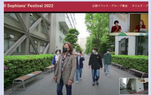
世界と繋がれるのがオンラインのメリット。遠隔地のソフィアンにも現在の大学の様子を紹介