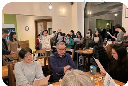
デュッセルドルフ・ソフィア会