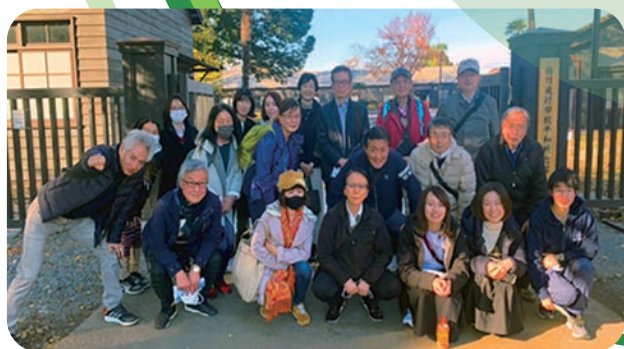
さいたまソフィア会

80年以上の歴史を持つ上智大学ソフィア会には、現在、世界中で300を超えるさまざまな同窓会がネットワークされ、活動しています。世界中どこに行っても、ソフィア会があるといっても過言ではありません。国内各地域にもそれぞれの地域ソフィア会があり、もちろん大学時代のOBOG会もソフィア会の名の下で活動しています。ソフィア会には、大学時代とはまた違った出会いがあります。