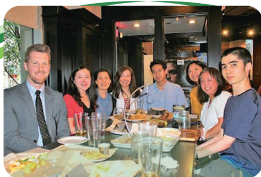
ワシントンDCソフィア会