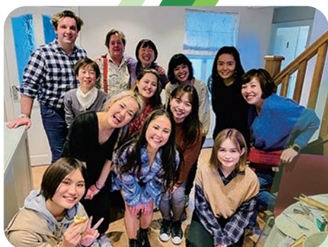
アイルランド・ソフィア会

80年以上の歴史を持つ上智大学ソフィア会には、現在、世界中で300を超えるさまざまな同窓会がネットワークされ、活動しています。世界中どこに行っても、ソフィア会があるといっても過言ではありません。国内各地域にもそれぞれの地域ソフィア会があり、もちろん大学時代のOBOG会もソフィア会の名の下で活動しています。ソフィア会には、大学時代とはまた違った出会いがあります。