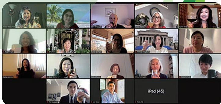
ニューヨーク・ソフィア会