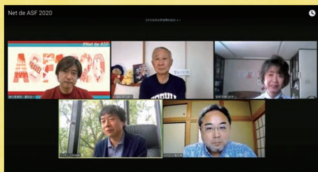
午後1時からのアジア・パシフィック編

例年は四谷キャンパスに1万人以上の卒業生とその家族が参加する、ソフィア会最大のイベント「オールソフィアの集い(ASF)」。 昨年はコロナの影響で残念ながらオンライン開催に。でもオンラインということで、半日で時差に従って地球を1周する形で、世界各地のソフィアンが参加するイベントになりました。 2021年のASFも5月30日(日)にオンラインで開催しますが、今年はさらに進化したオンライン・ホームカミングデイを目指しています。ご期待ください。