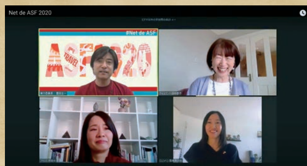
午後4時からのヨーロッパ編