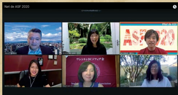
日本時間で午前10時半からのアメリカ編

例年は四谷キャンパスに1万人以上の卒業生とその家族が参加する、ソフィア会最大のイベント「オールソフィアの集い(ASF)」。 昨年はコロナの影響で残念ながらオンライン開催に。でもオンラインということで、半日で時差に従って地球を1周する形で、世界各地のソフィアンが参加するイベントになりました。 2021年のASFも5月30日(日)にオンラインで開催しますが、今年はさらに進化したオンライン・ホームカミングデイを目指しています。ご期待ください。