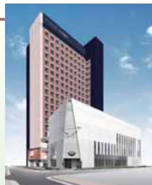
大阪サテライトキャンパス(完成予想図) 予想図は計画段階のものであり、施行上等の理由により変更となる場合があります。無断転載を禁止します。

また、このほかにも、インフォメーションコーナーを設置し、関西地区における広報活動の拠点とすることや、受験生に対する進学相談会、大学説明会、模擬授業などの会場、在校生のご父母との懇談の場、ソフィア会等同窓の活動拠点などさまざまな活用方法が検討されています。