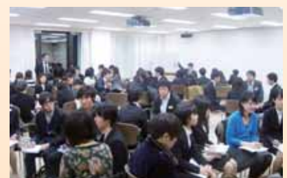
現役学生向けOBOG・内定者訪問セミナー