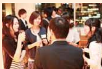
上智×一橋 平成卒業生、現役学生交流パーティー