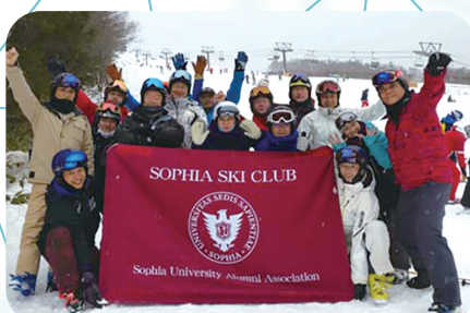
ソフィア会・スキークラブ