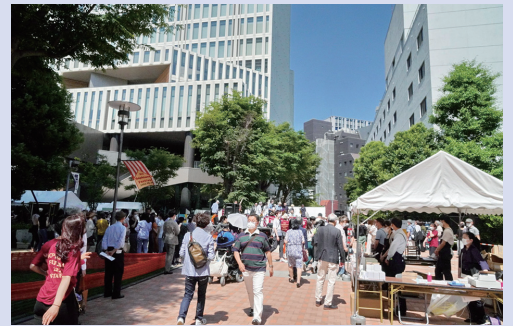
ASFの日はいつも快晴。昨年は、久々に四谷キャンパスに歓声がこだましました

メンストには野外ステージも復活、一方でオンラインでも2つのチャンネルで各地のソフィアンを結ぶ「Sophians around the world」を配信するなど、世界中のソフィアンを結ぶ新時代のASFの姿を浮き彫りにしました。当日は四谷キャンパスには約5,000人が来場、オンラインも約6,000人が視聴し、世界から合計1万1,000人が参加しました。