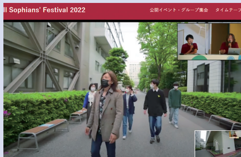
世界と繋がるのがオンラインのメリット。遠隔地のソフィアンにも現在の大学の様子を紹介

Sophia University Alumni Association (SUAA) held the All Sophians' Festival (ASF), an official SUAA event, on Sunday, May 29th.