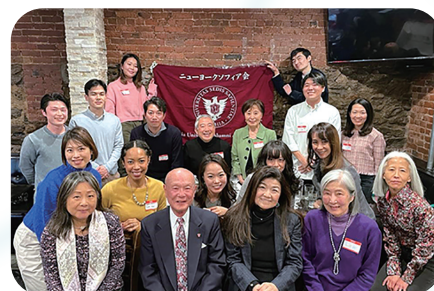
ニューヨーク・ソフィア会