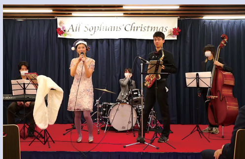
第二部の「つどい」では学生もパフォーマンスを

2022年のASCは、3年ぶりの対面参加とオンライン視聴での、ハイブリッド開催となりました。今回は食事とアルコールの提供をせず、密にならないように間隔を空けて椅子を配置、事前登録制の人数制限をしました。その結果、数日前には申込みを締切ることとなり、楽しみにしていたソフィアンの皆様にご迷惑をおかけしましたが、会場には懐かしい顔が集いました。