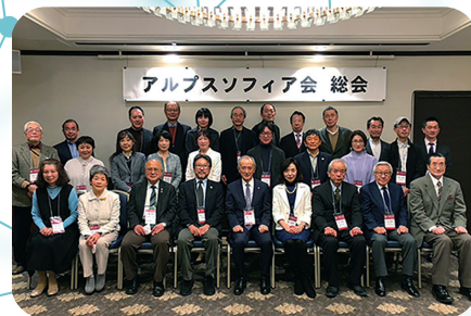
アルプス・ソフィア会