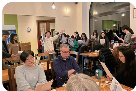
デュッセルドルフ・ソフィア会