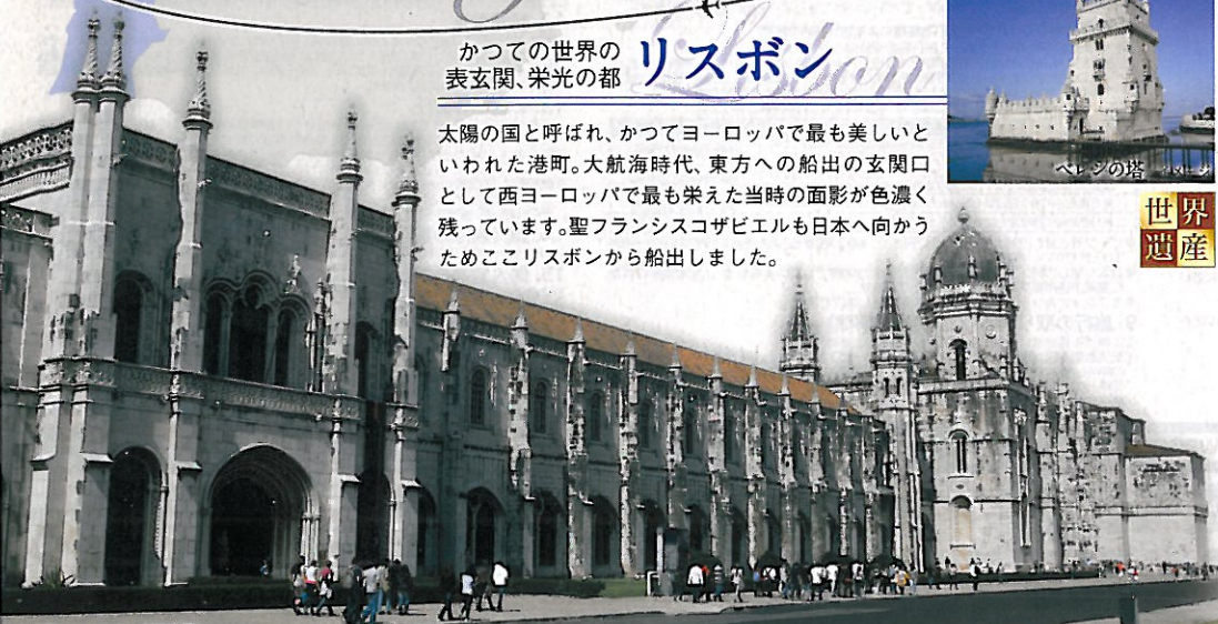
ジェロニモス修道院/イメージ