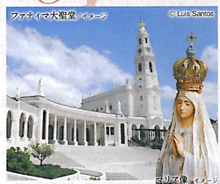
ファティマ大聖堂/イメージ