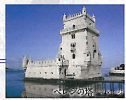
ベレンの塔/イメージ