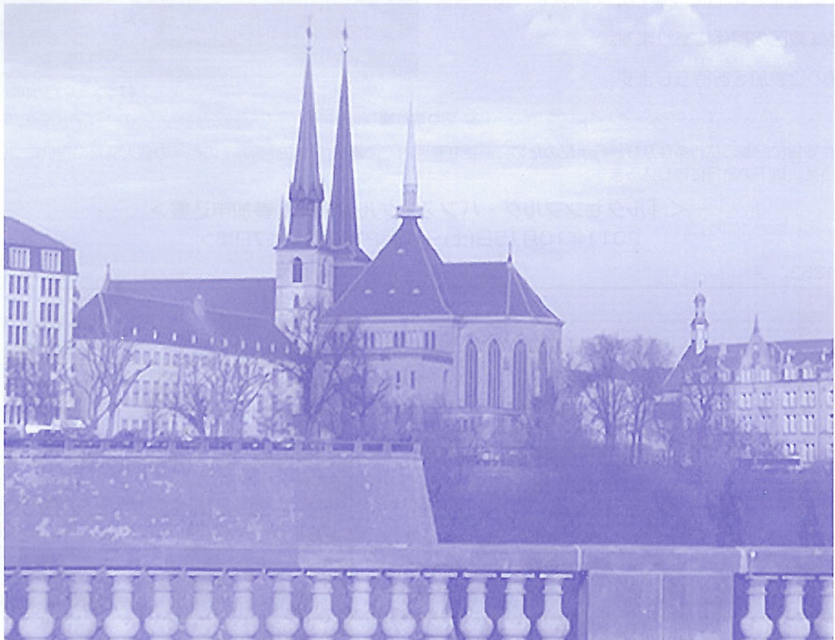
(ルクセンブルグのノートルダム大聖堂)

※各国空港税、航空保険・保安料、燃油特別付加運賃は含まれておりません。 (約77,190円<2011年8月22日現在>：旅行条件要旨をご参照下さい。)